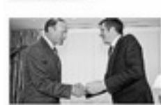
Pátxi López: "Así comparaba a Ibarretxe (el Barça) con Pátxi López (el Almedralejo) uno de los comentaristas de Arabatik, que se había hecho eco de lo evidente: lo puesto que estaba el lehendakari de Laudio con el tema de la paz... y lo poco que le ha importado y le importa al de Portugalete. Lo que nadie duda es que a Ibarretxe este anuncio no le hubiera pillado en un tren de camino a un fin de semana de asueto en EE.UU., ni que su ronda de contactos hubiera sido para mucho más que para la foto. A los hombres de Estado se les reconoce por las ganas que siempre tienen de sacar adelante un país."