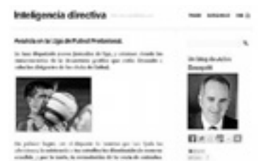
Julen Basagoiti: "Se dispuso que un partido se disputara los domingos a las doce del mediodía, prime-time en el mercado asiático. Pero resulta que los dos equipos que más tirón tienen en aquellas tierras (Barça y Real Madrid) no han jugado nunca a esa hora"... hasta el momento. O "¿Dónde está la Federación, responsable última de velar por la igualdad de condiciones en la competición?". Son solo alguna de sus acertadas dudas."

Julen Basagoiti la ha clavado en su blog en DEIA con su reflexión sobre cómo los contratos de retransmisión televisiva de los partidos puede acabar siendo la guillotina de la gallina de los huevos de oro, que es el fútbol. A saber: "Se dispuso que un partido se disputara los domingos a las doce del mediodía, prime-time en el mercado asiático. Pero resulta que los dos equipos que más tirón tienen en aquellas tierras (Barça y Real Madrid) no han jugado nunca a esa hora"... hasta el momento. O "¿Dónde está la Federación, responsable última de velar por la igualdad de condiciones en la competición?". Son solo alguna de sus acertadas dudas.