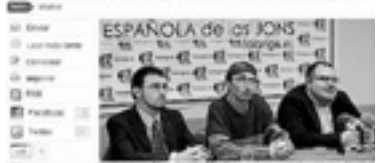
Falange y extrema derecha se quedan fuera del 20-N en Madrid. En la imagen, miembros del partido Falange durante una reunión.